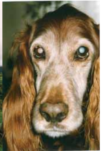
15-jährig, auf einem Auge erblindet

In den 16.5 Jahren, (sprich: sechzehneinhalb!), die wir gemeinsam durchs Leben gingen, sind wir nahezu einmal um die Welt gewandert.