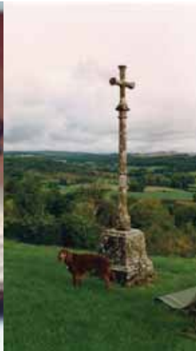
13-jährig in der Bretagne