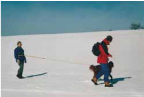
Aufbau mit Clicker für's Ski-Jöring