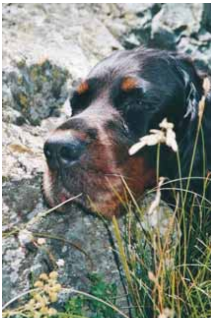
Pause auf dem Schilthorn