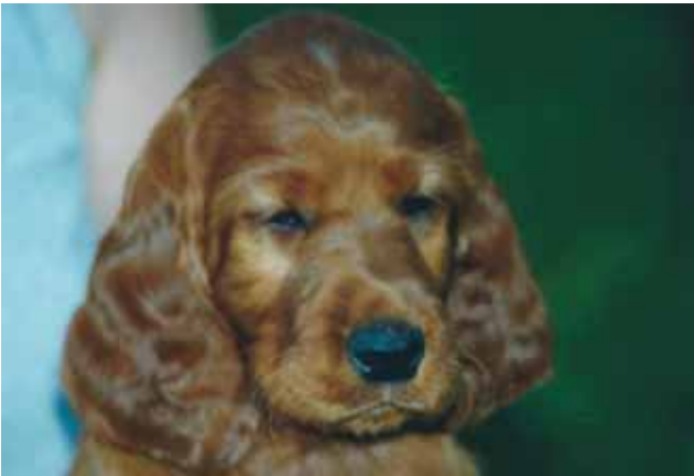
Bryony, 6 Wochen

Bryony war und ist noch immer mein souveräner, ehrlicher Allrounder: