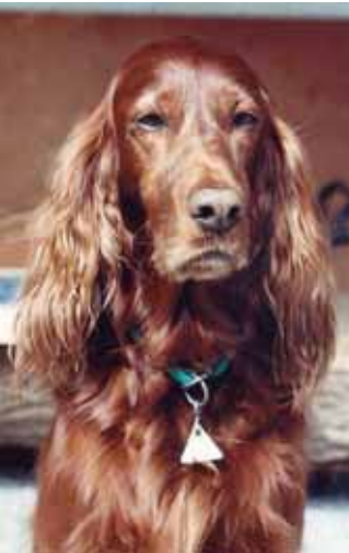
Im besten Alter