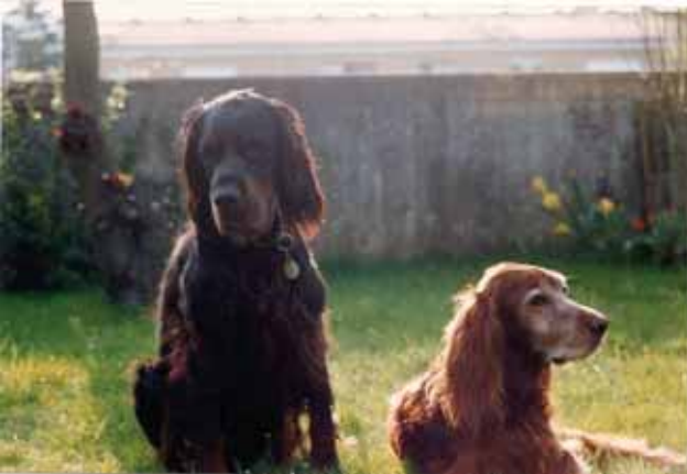
13-jährig mit Héline