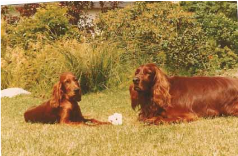
Silin, 8 Wochen alt, mit Ken, einem Rüden aus derselben Zucht...