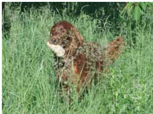
Dummy-Training als Jagdersatz