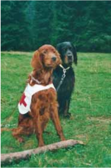
1-jährig beim „Sanele“