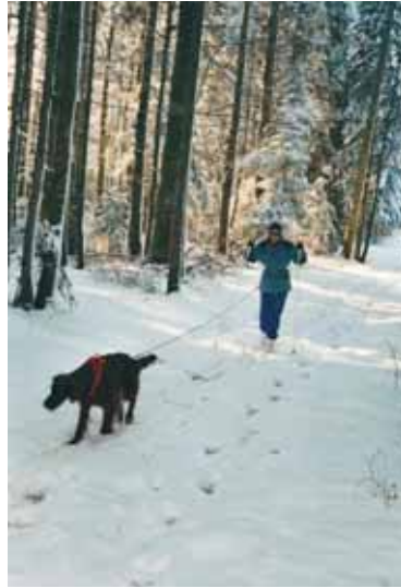
2-jährig beim Langlauf